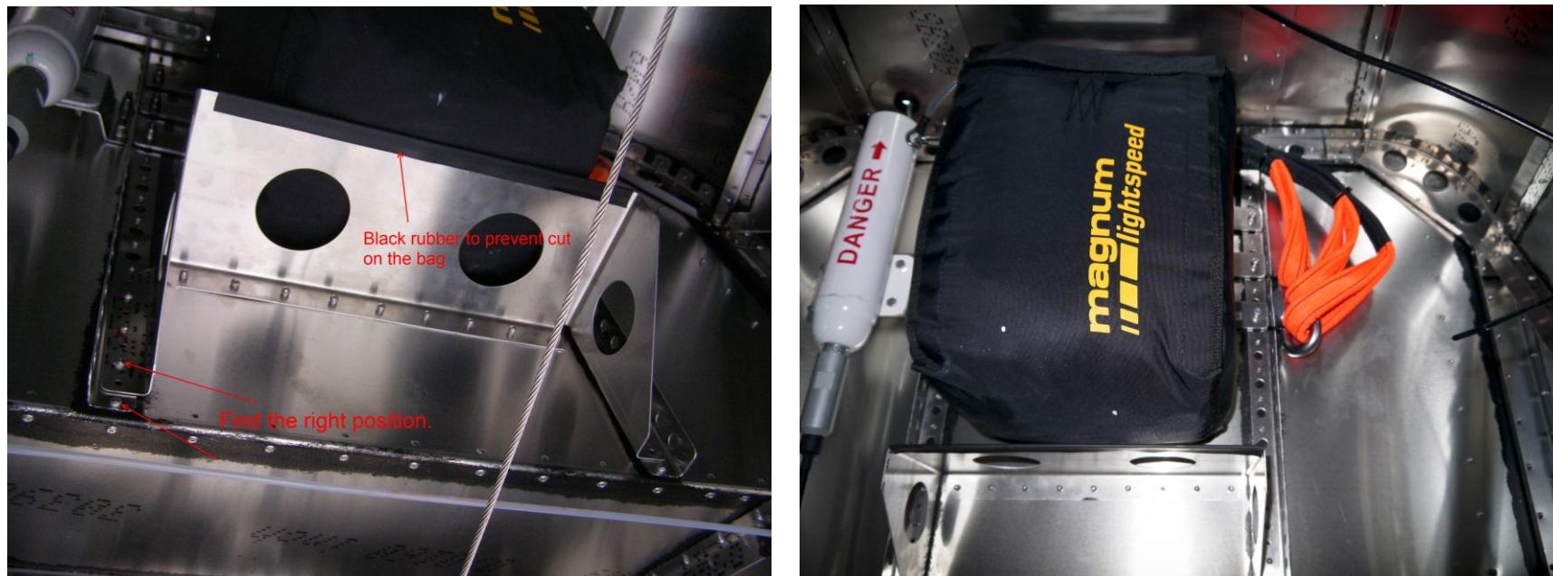
Fig. n. 2

Installare il supporto sacca ST297 sugli ultimi 5 fori degli angolari a "C". Trovare la giusta posizione in modo che la sacca appoggi sulla staffa. Spostare quindi quest'ultima in alto o in basso. Se necessario riforare la staffa a metà tra i fori presenti. Applicare la guarnizione fornita sul bordo della staffa ST297 come indicato in foto 2 fissandola con colla cianocrilica.